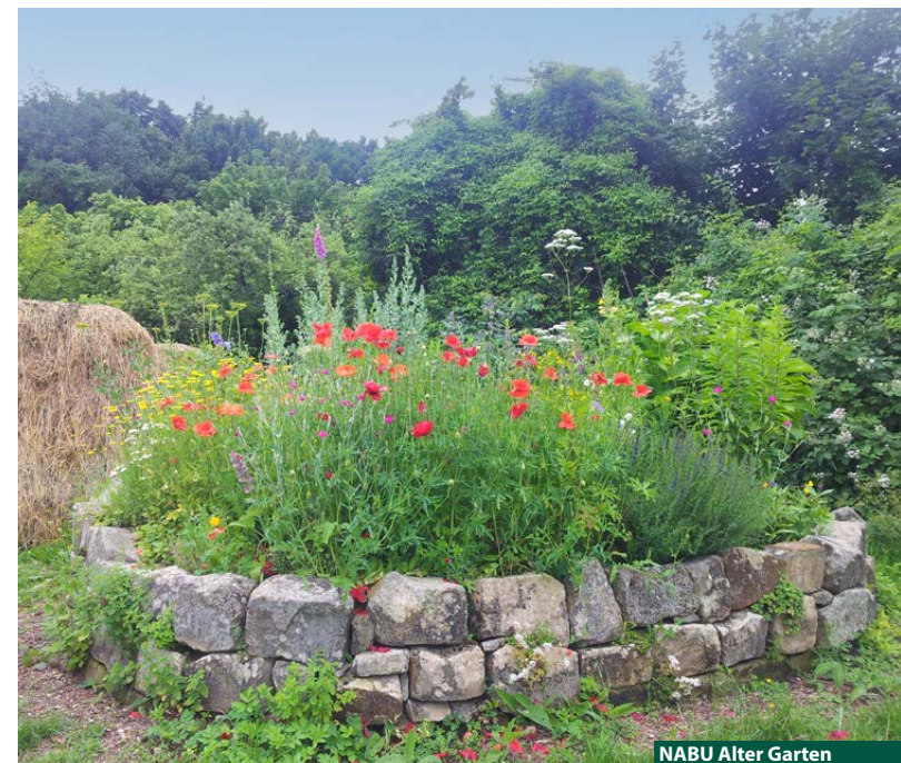
NABU Alter Garten