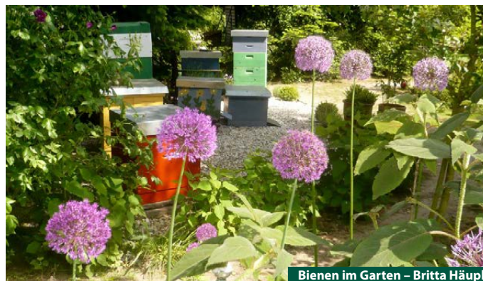
Bienen im Garten – Britta Häupl